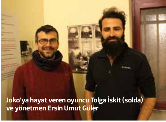
Joko'ya hayat veren oyuncu Tolga İskit (solda) ve yönetmen Ersin Umut Güler